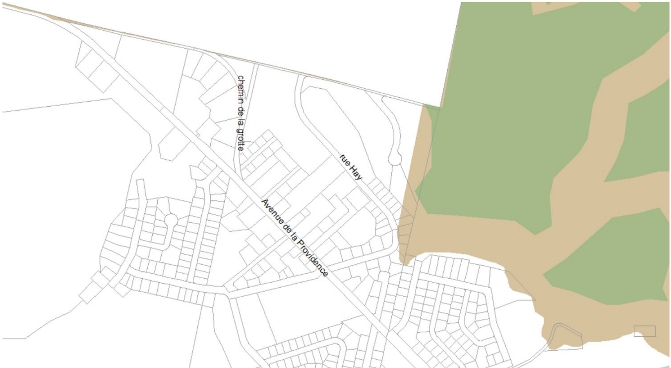
Zone PIIA-013 escarpement actuel